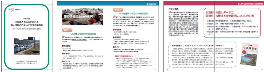
災害時の自治体における個人情報の取扱いに関する事例集